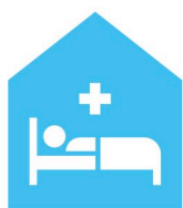
Hôpitaux, cliniques Spitäler, Kliniken

Animiert vom Wunsch nach Innovation bietet das Healthcare Team eine neue Reihe von Verbrauchsmaterialien und Geräten an, die an der Spitze der Bio-Reinigung und Körperpflege für Gesundheitseinrichtungen entstehen.