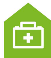
Services de soins à domicile Hauspflegeservice