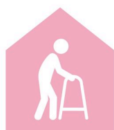
Homes, établissements médico-sociaux Pflegeheime, Pflegeinstitutionen