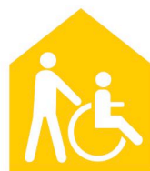
Foyers médicalisés Medizinische Heime