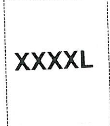
Etichetta taglia per sacchetto