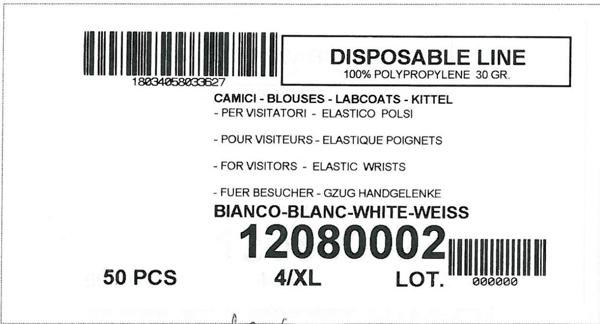
Etiquette pour carton