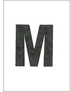
Etiquette taille pour sachet