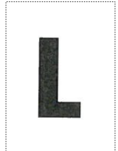
Etiquette taille pour sachet