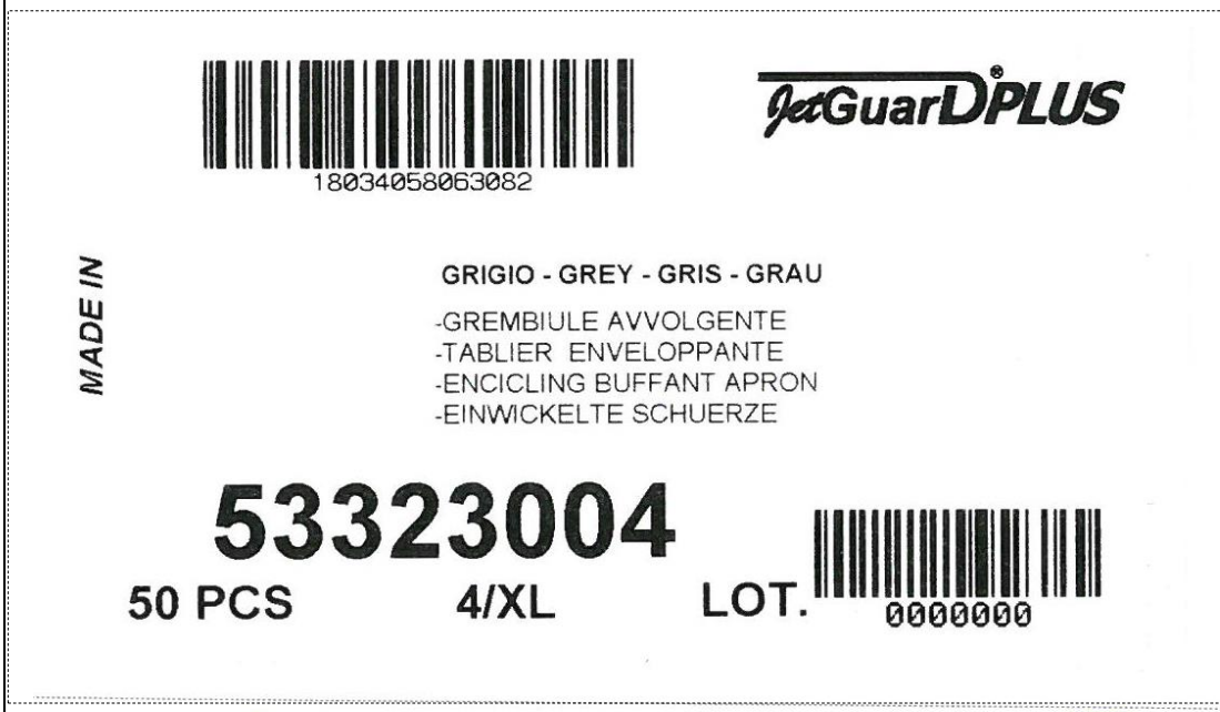
Etiquette taille pour vêtement