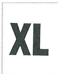
Etichetta taglia per sacchetto