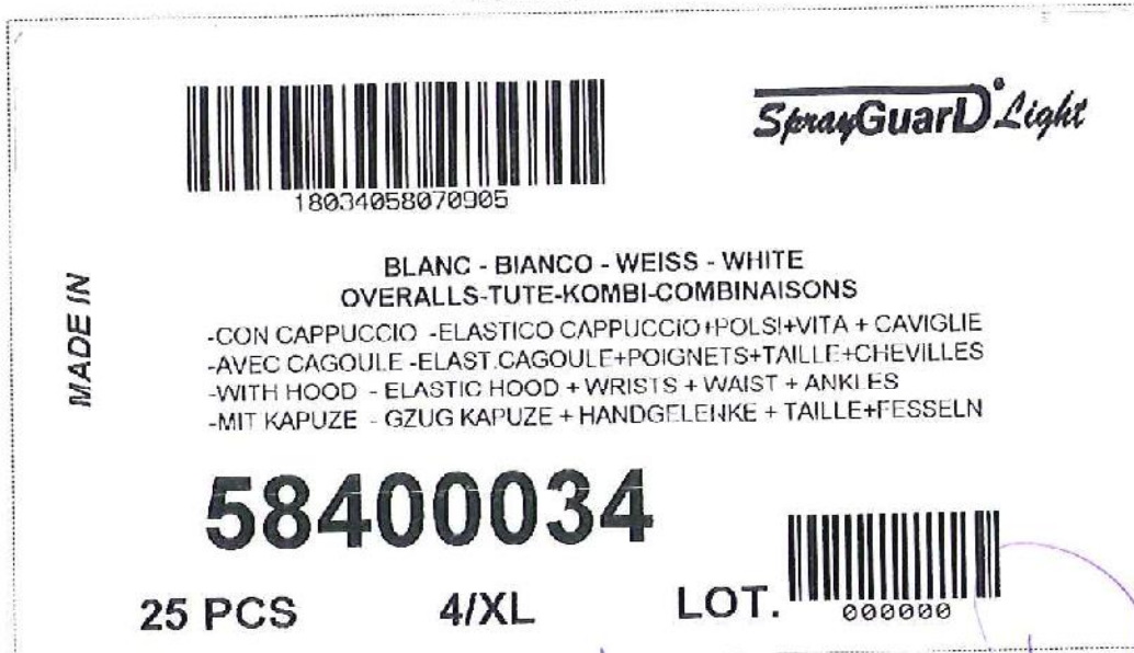
Etichetta taglia per indumento